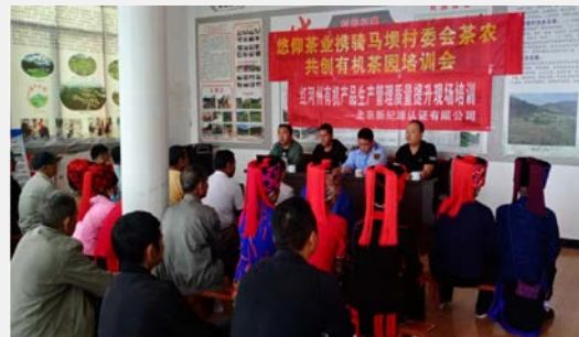
小微企业质量提升培训

2022年XJY为6家小微企业进行了质量提升培训，让企业人员对质量管理体系有一个深刻的理解，并向企业宣传质量提升的好处，鼓励企业积极参与。