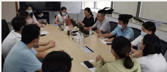
2022年“珠海创投港珠澳大桥珠海口岸运营管理有限公司”质量、环境、职业健康安全管理体系认证 现场审核