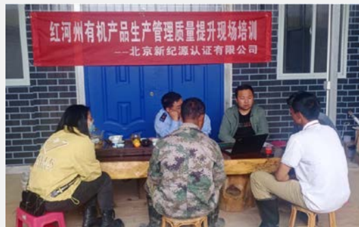
小微企业质量提升培训