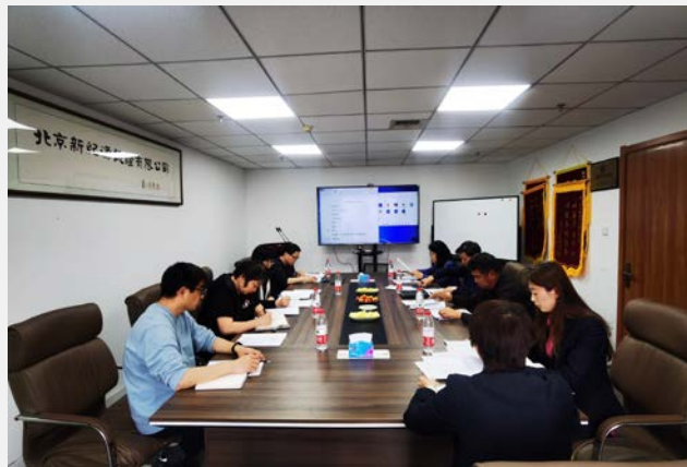
2022年公正性委员会会议

风控技术部定期抽查项目受理的合规性、符合性、人员评定的符合性、对现场审核实施合规性进行监管（监视认证到系统审核首末次会议签到时间及位置、差旅费有效性核实、现场照片核实等），如发现有审核员在审核中存在违规行为严肃处理，绝不姑息。风控技术部采用共享位置、电话回访等方式加强现场审核检查力度，最大限度的控制认证风险。公司管理层在多个场合对审核员进行教育，要求做到“懂规矩、严程序、守纪律”。